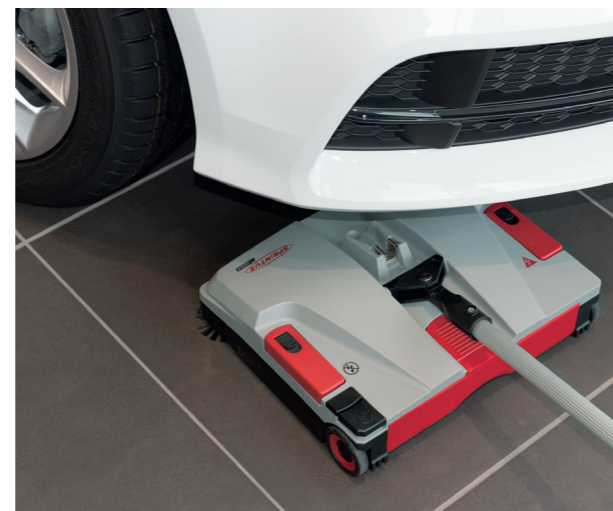
Kabellos, effizient, kompakt und wendig.