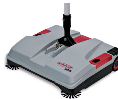
Rotierende Seitenbesen für perfekte Ergebnisse in Ecken und Kanten.