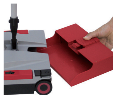
Besonders geräumige Schmutzschublade mit 2 Liter Volumen.